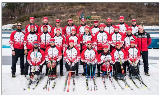
L'équipe paranordique canadienne 2018

Les skieurs debout ont généralement une déficience à un membre supérieur ou une vision limitée. Les athlètes qui ont une vision limitée skient avec l'aide